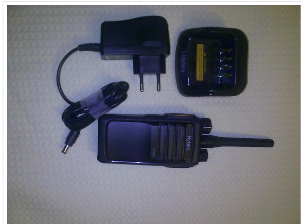
HYTERA PD-505 DMR Radio