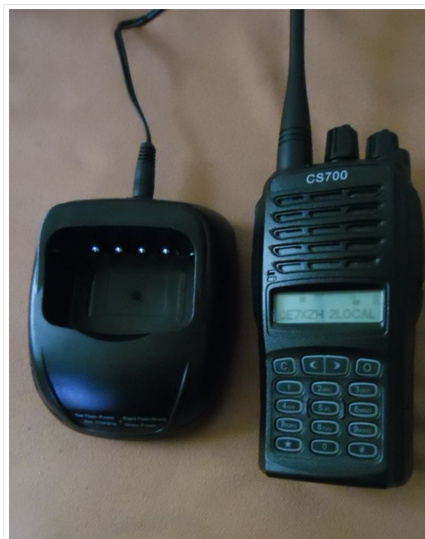
CS700 mit Ladestation

Empfehlenswerte Mailingliste hierzu: https://groups.yahoo.com/neo/groups/csidmr/