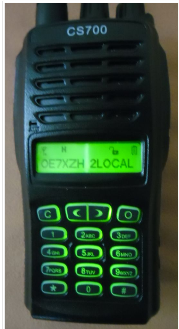
CS700 DMR Radio

Version vom 20. Dezember 2014, 09:11 Uhr