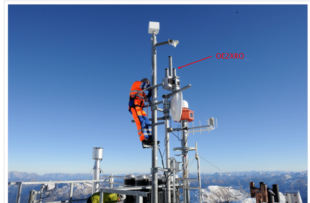
Blick auf die Bake OE2XRO mit 3 Antennen