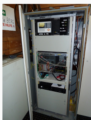
Anlagenschrank OE7XGR 2017