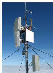
Antennenanlage OE7XGR, OE7FMI im Oktober 2009