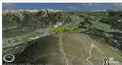
3D-Simulation: Blick vom Ranggerköpfl