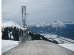
Blick ins winterliche Oberland

Mitte 2014 wurde die Anlage am Rangger Köpfl um das DMR-Relais (QRG: 439.075 MHz -7.6 MHz Shift, Motorola DR3000) unter vollständiger Beibehaltung der Empfindlichkeit des analogen Umsetzers erweitert. Am selben Standort befindet zudem noch u. A. ein APRS-IGATE (144.800 MHz).