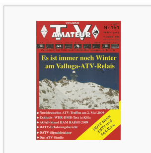
Titelbild: Ausgabe 151