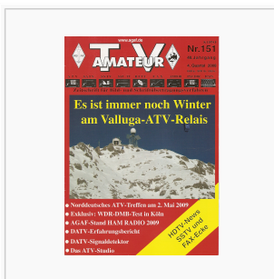
Titelbild: Ausgabe 151