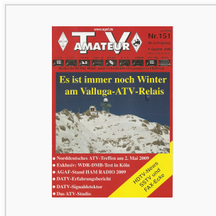
Titelbild: Ausgabe 151