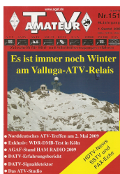
Titelbild: Ausgabe 151