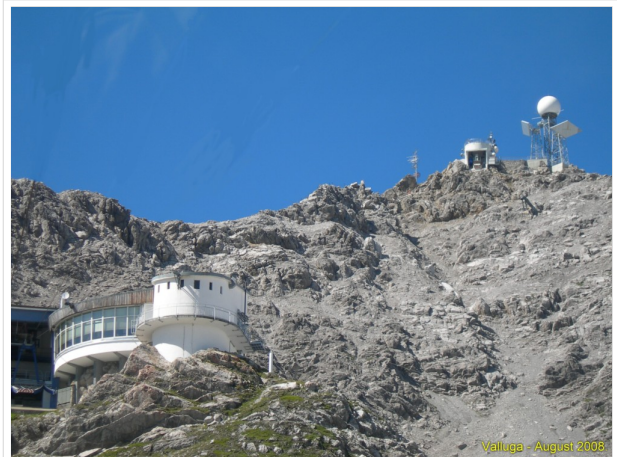
Valluga im Sommer