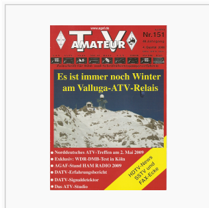
Titelbild: Ausgabe 151