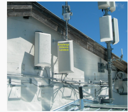
Empfangsantenne Richtung Landeck