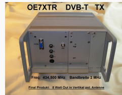
OE7XTR DVB-T TX 70cm