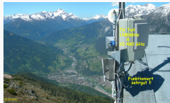
TX Teil 10.480 und 1.280 MHz