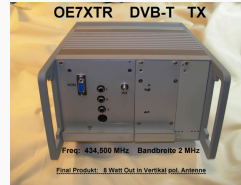
OE7XTR DVB-T TX 70cm