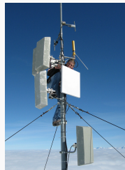
Antennenanlage OE7XGR, OE7FMI im Oktober 2009