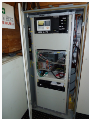
Anlagenschrank OE7XGR 2017