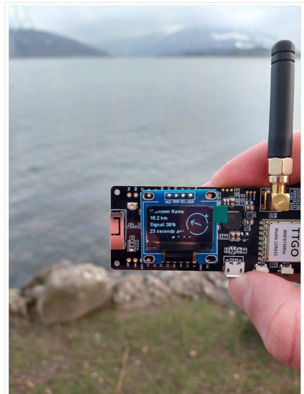
TBEAM Lora mit OLED-Display