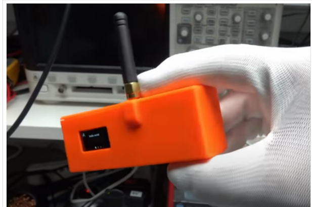
TBEAM im 3D-gedrucktem Gehäuse