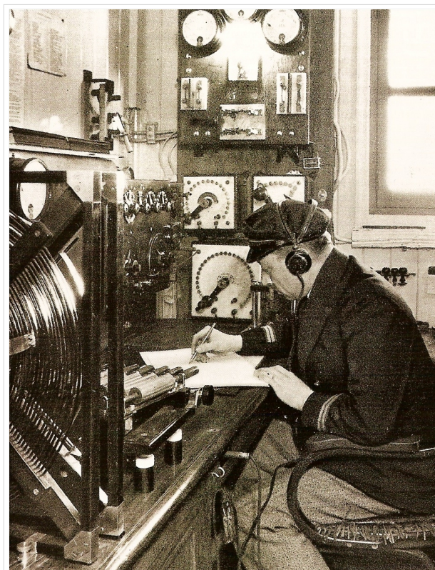
Funkraum eines Frachters ca. 1922