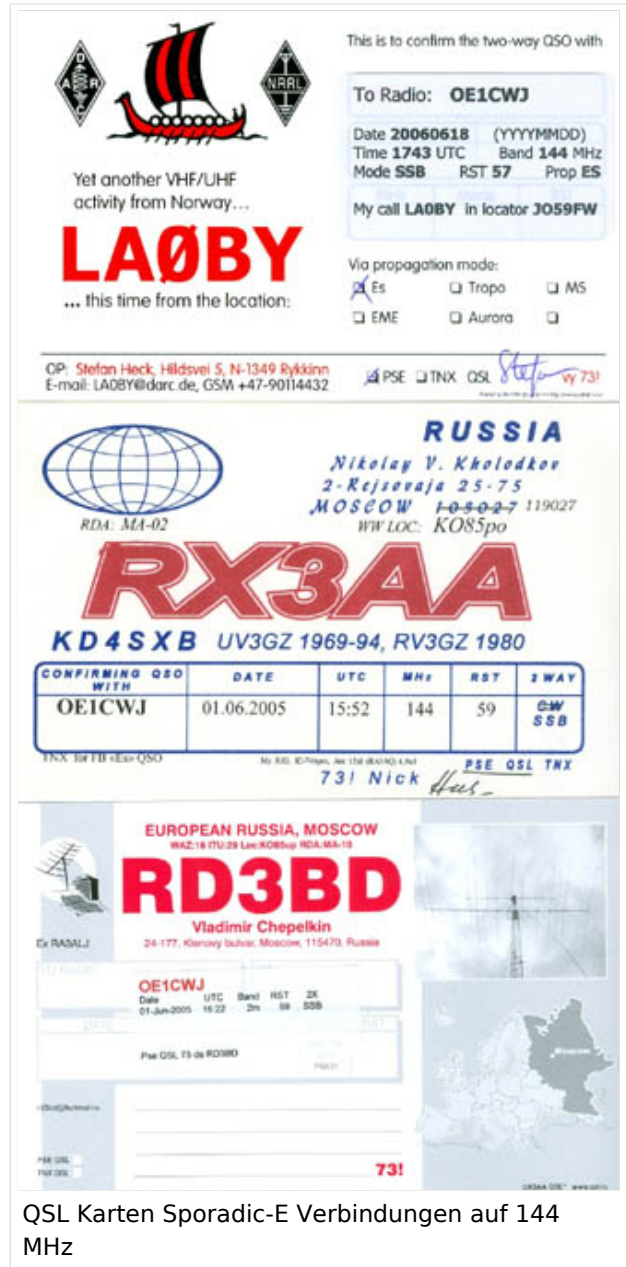
QSL Karten Sporadic-E Verbindungen auf 144 MHz