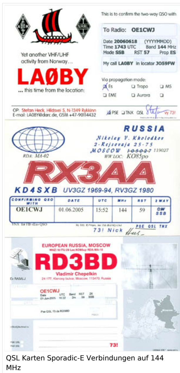
QSL Karten Sporadic-E Verbindungen auf 144 MHz