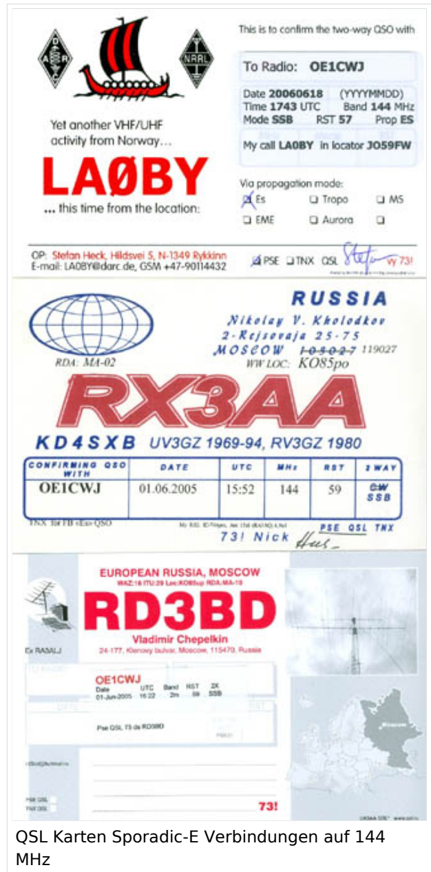
QSL Karten Sporadic-E Verbindungen auf 144 MHz