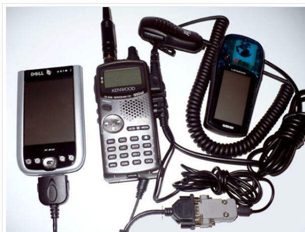
Ziemlich viele Kabel für einen Rucksack.

So einfach es ein mag, bestehendes Equipment zusammenzuschalten (Handheld, GPS/Maus, Tracker, Stromversorgung) ist der entstandene Kabelsalat nicht immer besonders rucksacktauglich.