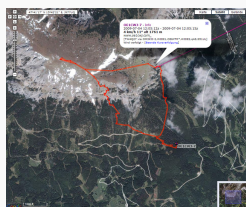
Heukuppe/Rax Juli 2009