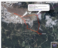
Heukuppe/Rax Juli 2009

Fehler beim Erstellen des Vorschaubildes: Datei fehlt