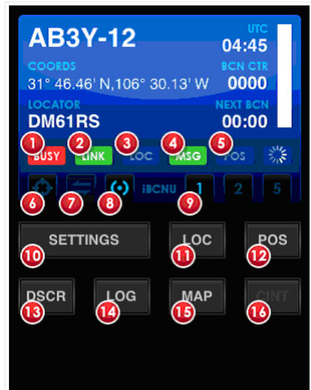
APRS auf dem iPhone mit iBCNU