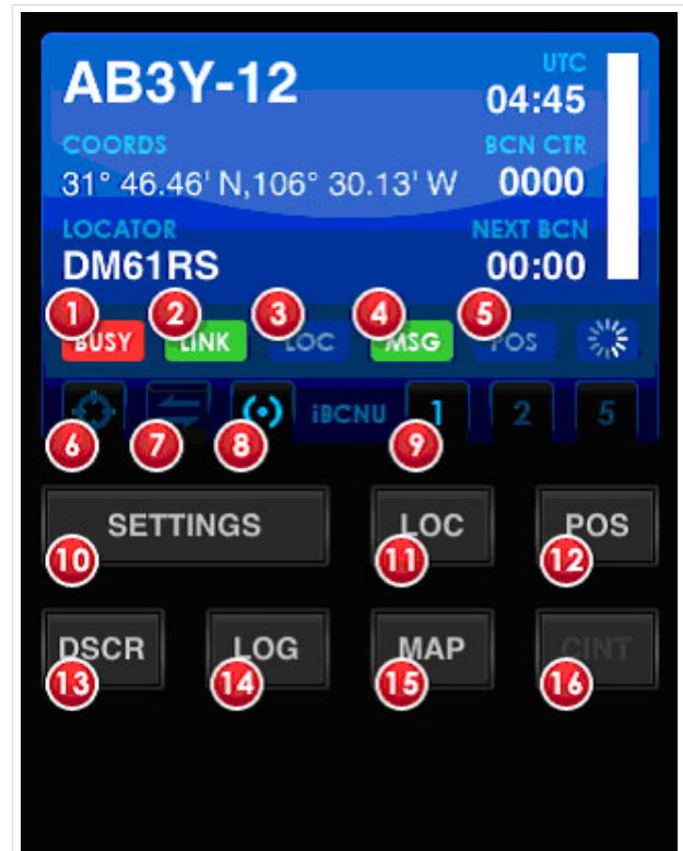
APRS auf dem iPhone mit iBCNU

Wie jede Applikation für das iPhone kann diese Software für den Amateurfunk über iTunes heruntergeladen werden - zum Hampreis von 1,99 USD