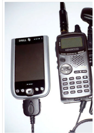
Ziemlich viele Kabel für ein VA3ROM