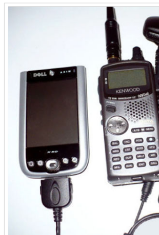
Ziemlich viele Kabel für ein VA3ROM