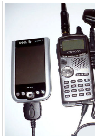
Ziemlich viele Kabel für e VA3ROM

So einfach es ein mag, bestehendes Equipment für den Mobilbetrieb zusammenzuschalten (Handheld, GPS /Maus, Tracker, Stromversorgung) - der entstehende Kabelsalat ist nicht immer besonders rucksacktauglich. Erst seitdem Yaesu das VX8 mit einem in das externe Mikrofon integrierbaren GPS Empfänger auf den Markt gebracht hat, gibt es hier eine wirklich alltagstaugliche Lösung für den Portabelbetrieb. Das Gerät ist zudem nach IPX7 wasserfest und und auch wenn beim Wandern mal ein Regenschauer kommen sollte, muss man keine Angst um sein Gerät haben muss. Dieses leichte Gerät (unter 300g) verdient wirklich die Bezeichnung ALL-in-ONE, zumal es gleichzeitig ein sehr komfortables Handfunkgerät mit