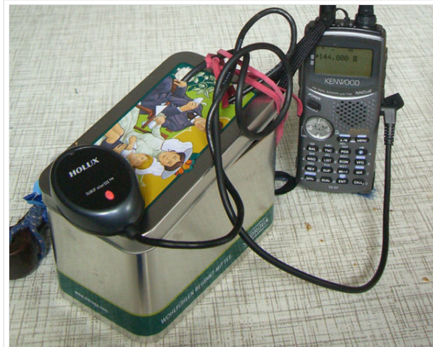
Erste Versuche mit GPS Maus und Blechdose zum Verstauen von allerlei fliegendem Aufbau und "hightech" Magnethalterung

Handfunkgerät mit jeder Menge Spielmöglichkeit beinhaltet (9k6 TNC, Bluetooth, CW-Trainer, Rundfunkempfang, LED-Lampe usw.) Der Preis ist nur unwesentlich höher als manche Bastellösung, die Bedienung dieses kleinen Wunderwerkes im Alltag ist jedoch nur nach intensivem Studium der Gebrauchsanleitung und regelmäßiger Übung (hi) möglich. Und der 1800mAh li ionen Akku hält länger als einen oft die Füße tragen.