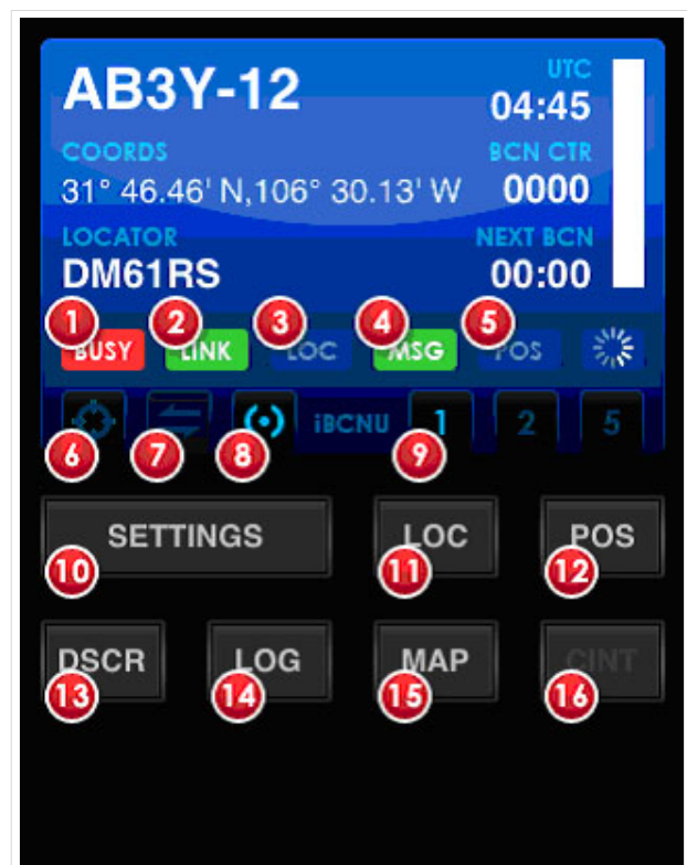
APRS auf dem iPhone mit iBCNU