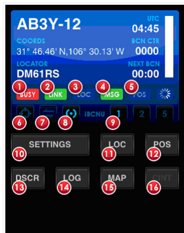
APRS auf dem iPhone mit iBCNU