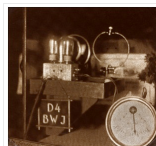
Sender Rudi Rapcke, Kurzwellentechnik des DASD 1935.jpg

Zum Empfang verwendete man zumeist eine gewöhnliche Audionschaltung (als Geradeausempfänger) mit kapazitiv veränderbarer Rückkopplung und normalen Empfängerröhren. Nachstehend ist eine Schaltung aus dem Buch „Sende-Praktikum für KW-Amateure“ von 1935 abgedruckt. Sendemäßig wurden ganz normale Schwingungsschaltungen als Dreipunkt Anordnungen oder (besser) im Gegentakt mit üblichen Verstärkerröhren, z.B. RE 134/RE 504 benutzt. Über Einzelheiten wird auf den nachfolgenden Seiten über 5m- Sender berichtet. Als Sendeantennen wurden vertikale Dipole oder ein in Oberwellen erregter Draht über abgestimmte Parallellleitungen verwendet. Zur Frequenzmessung diente das Lechersystem - Koaxialkabel und Yagi Antennen waren noch nicht bekannt.