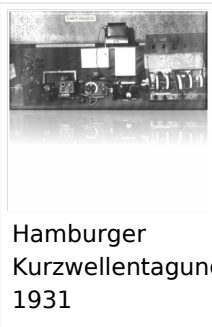
Hamburger Kurzwellentagung 1931