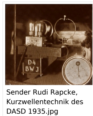
Sender Rudi Rapcke, Kurzwellentechnik des DASD 1935.jpg

Zum Empfang verwendete man zumeist eine gewöhnliche Audionschaltung (als Geradeausempfänger) mit kapazitiv veränderbarer Rückkopplung und normalen Empfängerröhren. Nachstehend ist eine Schaltung aus dem Buch „Sende-Praktikum für KW-Amateure“ von 1935 abgedruckt. Sendemäßig wurden ganz normale Schwingungsschaltungen als Dreipunkt Anordnungen oder (besser) im Gegentakt mit üblichen Verstärkerröhren, z.B. RE 134/RE 504 benutzt. Über Einzelheiten wird auf den nachfolgenden Seiten über 5m- Sender berichtet. Als Sendeantennen wurden vertikale Dipole oder ein in Oberwellen erregter Draht über abgestimmte Parallelleitungen verwendet. Zur Frequenzmessung diente das Lechersystem - Koaxialkabel und Yagi Antennen waren noch nicht bekannt.