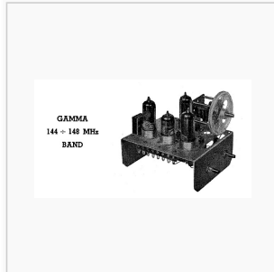
DL3XC: Baukosten laut Verfasser DM 39,70: 2 Röhren DM12,00, Trafo DM 5,00

„2m-Transceiver von Willy Fischer, DL1AG aus CQ 2/1950““ Nachdem in Heft 10/1949 das kleine Gerät von B. Cramer beschrieben wurde, folgt hier die Schaltung eines weiteren tragbaren Transceivers von Willy Fischer, DL 1 AG. Zur Röhrenbestückung gehören 2 Stück 2,4P2, wobei die eine als Triode geschaltet ist. Für den A2-Betrieb dient eine kleine Zwergglühlampe als Tongeber. So ist ohne Umschaltung Telegrafie und Telefonie möglich. Das Potentiometer R4 dient zum Einstellen der Tonhöhe bei Empfang und Sendung. Die Umschaltung von Senden auf Empfang erfolgt durch ein Relais, welches durch einen kleinen Schalter im Handapparat betätigt wird. Die größte Reichweite mit einfachem Dipol betrug 90 km.