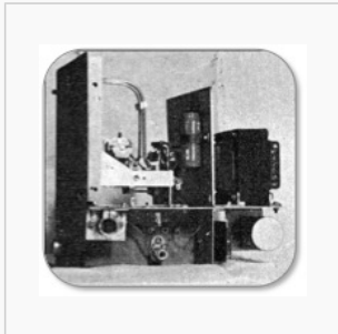
Wallmann Konverter Seitenansicht