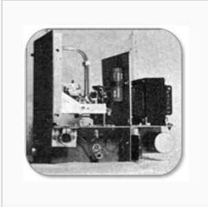
Wallmann Konverter Seitenansicht