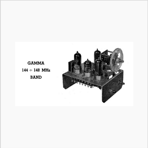
DL3XC: Baukosten laut Verfasser DM 39,70: 2 Röhren DM12,00, Trafo DM 5,00

““2m-Transceiver von Willy Fischer, DL1AG aus CQ 2/1950““ Nachdem in Heft 10/1949 das kleine Gerät von B. Cramer beschrieben wurde, folgt hier die Schaltung eines weiteren tragbaren Transceivers von Willy Fischer, DL 1 AG. Zur Röhrenbestückung gehören 2 Stück 2,4P2, wobei die eine als Triode geschaltet ist. Für den A2-Betrieb dient eine kleine Zwergglimmlampe als Tongeber. So ist ohne Umschaltung Telegrafie und Telefonie möglich. Das Potentiometer R4 dient zum Einstellen der Tonhöhe bei Empfang und Sendung. Die Umschaltung von Senden auf Empfang erfolgt durch ein Relais, welches durch einen kleinen Schalter im Handapparat betätigt wird. Die größte Reichweite mit einfachem Dipol betrug 90 km.