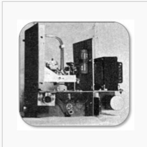
Wallmann Konverter Seitenansicht