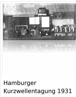
Hamburger Kurzwellentagung 1931