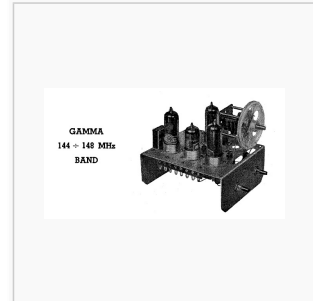
DL3XC: Baukosten laut Verfasser DM 39,70: 2 Röhren DM12,00, Trafo DM 5,00

““2m-Transceiver von Willy Fischer, DL1AG aus CQ 2/1950““ Nachdem in Heft 10/1949 das kleine Gerät von B. Cramer beschrieben wurde, folgt hier die Schaltung eines weiteren tragbaren Transceivers von Willy Fischer, DL 1 AG. Zur Röhrenbestückung gehören 2 Stück 2,4P2, wobei die eine als Triode geschaltet ist. Für den A2-Betrieb dient eine kleine Zwergglühlampe als Tongeber. So ist ohne Umschaltung Telegrafie und Telefonie möglich. Das Potentiometer R4 dient zum Einstellen der Tonhöhe bei Empfang und Sendung. Die Umschaltung von Senden auf Empfang erfolgt durch ein Relais, welches durch einen kleinen Schalter im Handapparat betätigt wird. Die größte Reichweite mit einfachem Dipol betrug 90 km.