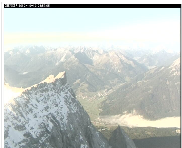
Zugspitze OE7XZR Panoramakamera

Datei:bkh montagen1.jpg OE7BKH im April 2010