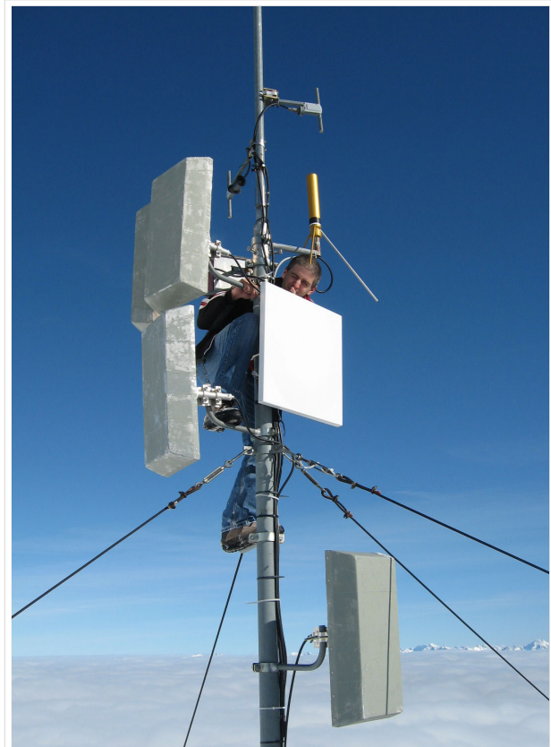
Montage Link nach Meran, OE7FMI Oktober 2009

Datei:bkh montagen1.jpg OE7BKH im April 2010