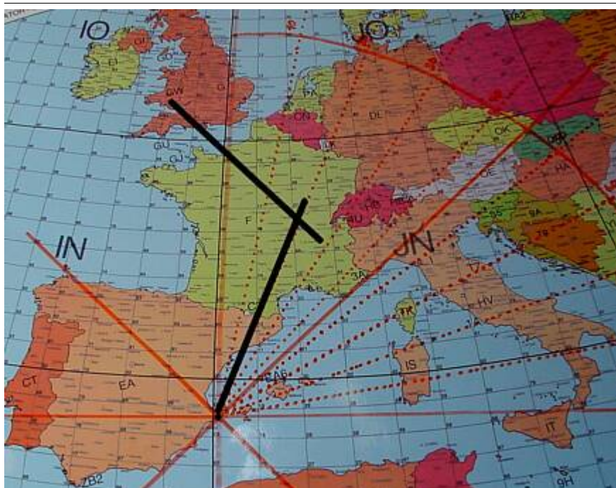
Beispiel für Sidescatter

Wenn GW8ASA zufällig meinen CQ-Ruf, den ich in Richtung Deutschland abgesetzt habe, in seiner Antennenrichtung nach Italien gehört hat, sollte er seine Antenne auf keinen Fall in meine Richtung (EA5 für ihn wäre Süden) nachdrehen, denn dann haben unsere "Sendestrahlen" keinen gemeinsamen Schnittpunkt mehr.