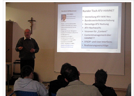
OAFT 2010 - Runder Tisch ATV /HAMNET