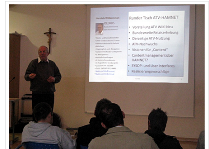
OAFT 2010 - Runder Tisch ATV /HAMNET