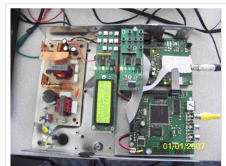
70cm ATV-Empfänger - Feldversuch im April 2010