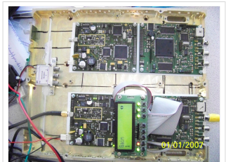
70cm ATV-Sender - Feldversuch im April 2010

Der Sender ist auf 2MHz Bandweite, 1/4 Guard, FEC 1/2 eingestellt. Dies entspricht einer Nettodatenrate von 2,49 MBit/sec (~1390MSymb). Schulterabstand ohne PA -45dbc, mit PA -35dbc. PA wird mit 1 mW angesteuert und liefert ca. 0,6Watt. Darüber steigt die Schulterung rapide an. Das mModul würde etwa 33 Watt HF erzeugen. Die PA wird 17 DB unter der max Leistung betrieben. In AM ATV war sie mit 15 Watt im Einsatz.