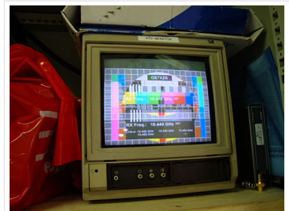
HB9 ist QRV mit OE7

Letztes Update --oe3rbs 19:10, 24. Okt. 2010 (UTC)