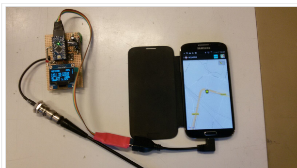
LoRa Empfänger mit angeschlossenen Handy mit Positionsanzeige via W2APRS

Klaus DJ700 hat auf seiner Homepage [6] auch eine Schaltung für einen Empfänger mit Display, dessen Nachbau sehr einfach ist, gepostet.