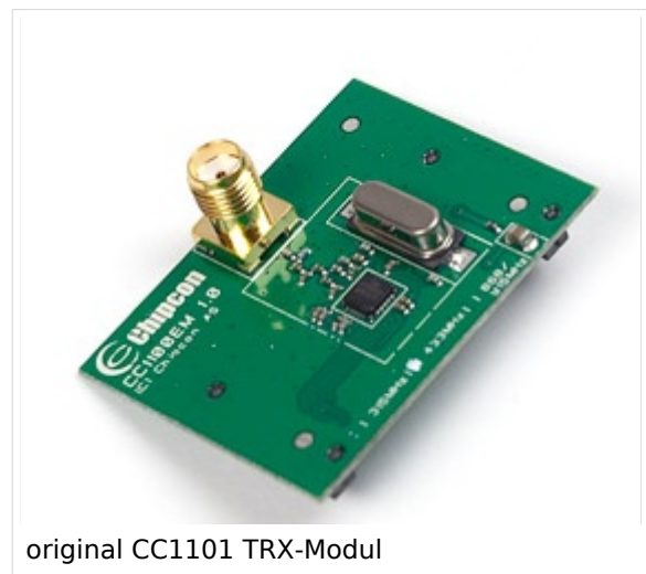
original CC1101 TRX-Modul