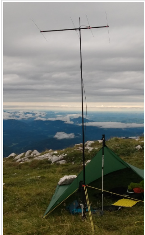
4 Element Yagi gebaut von OE5JFE