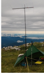
4-Ele-2m gebaut von OE5JFE.jpg 312 × 516; 67 KB

Diese Kategorie enthält nur folgende Datei.