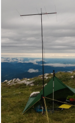
4-Ele-2m gebaut von OE5JFE.jpg 312 × 516; 67 KB

Diese Kategorie enthält nur folgende Datei.