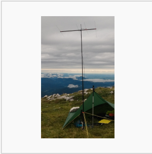
4-Ele-2m gebaut von OE5JFE.jpg 312 × 516; 67 KB

Diese Kategorie enthält nur folgende Datei.