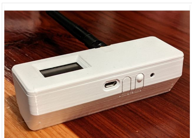
TBEAM Gehäuse mit Tasten und OLED