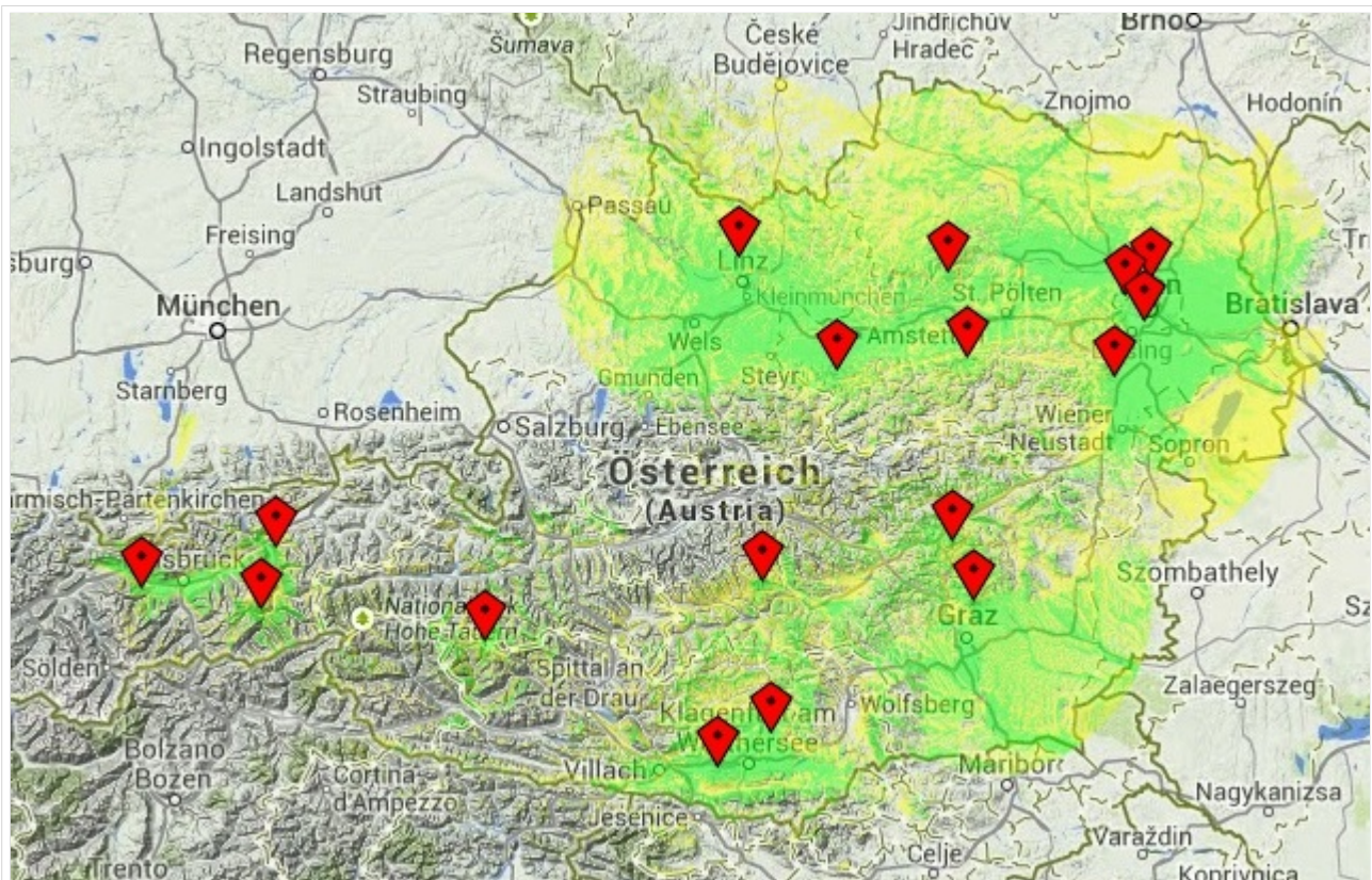
Darstellung der Motorola DMR Abdeckung in Österreich auf TG232