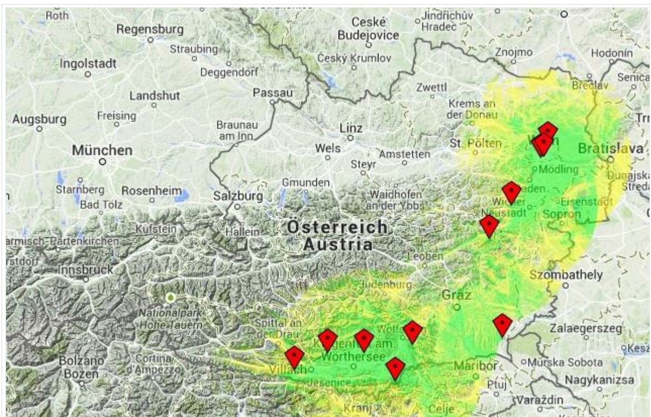
Darstellung der Hytera DMR Abdeckung in Österreich auf TG232