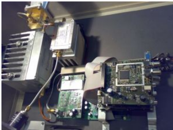
Die neuen Digital-