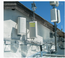
Empfangsantenne Richtung Landeck