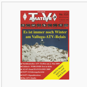
Titelbild: Ausgabe 151