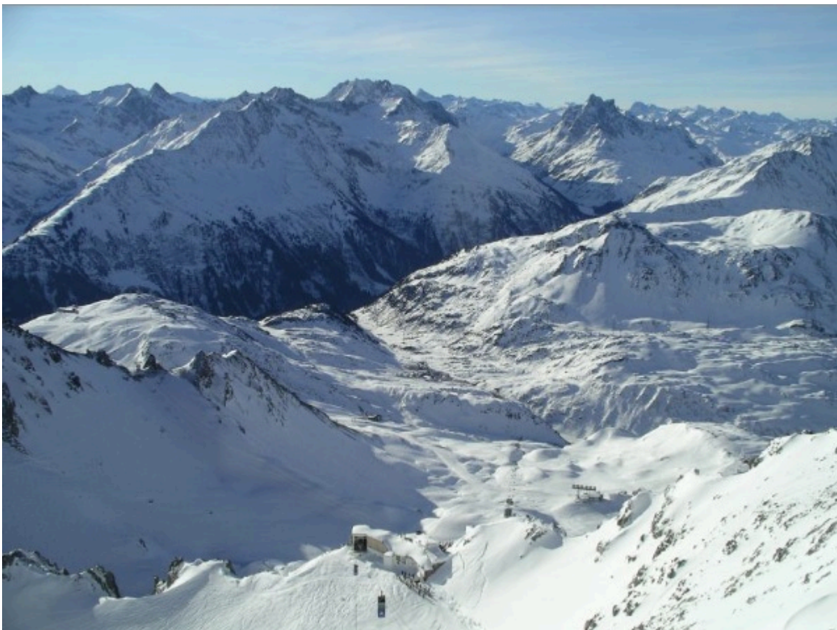
Ausblick von der Valluga

Das Amateurfunkfernsehen Relais OE7XVR (zuvor OE7XSI) befand sich auf der Valluga in JN57CD, einem 2809m hohen Berg in den westlichen Lechtaler Alpen, zugleich der höchste Gipfel im Arlberggebiet entlang der Grenze zwischen den österreichischen Bundesländern Tirol und Vorarlberg. Die Valluga liegt inmitten des einzigartigen Wintersportgebiets Arlberg. Dieses ATV-Relais nahm seinen Betrieb im September 2004 auf, im Mai 2009 erfolgte die Rufzeichenänderung des Valluga-Umsetzers von OE7XSI zu OE7XVR.